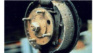
Garnitures de frein