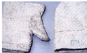
Gants de protection