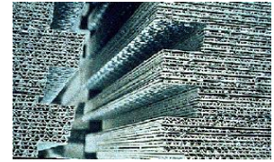
Plaques de faux-plafond