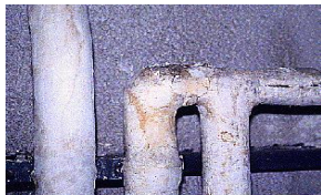
Calorifugeage de tuyaux