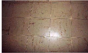
Dalles de sol