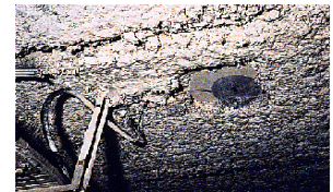
Flocage de plafond